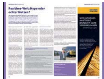
Muster Firmenporträt + Inserat

Inserat: PDF, CMYK, 300 dpi, 81 x 257 mm