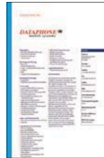
Muster Firmeneintrag Print + Online

Logo für Web: GIF oder JPG, RGB, max 50 KB, 200 x 200 Pixel